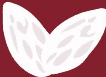
Frutos secos (Ex. Amêndoas)